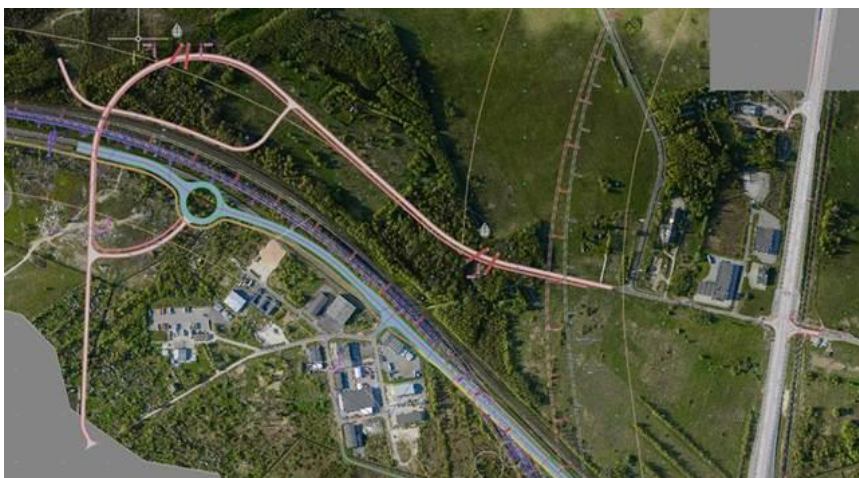
Joonis 3. Varivere tee perspektiivne liiklussõlm